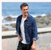
Blouson ... Blanche Porte 37,99€