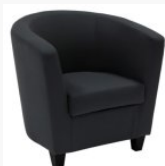
Cabriolet ... BUT 131,99€