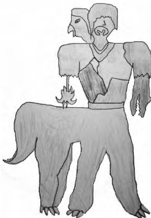
Ilustração 1 – O mítico centauro, em um desenho de pessoa louca, feito por uma criança italiana.

O desenho do louco como um centauro é único em sua evocação mitológica, mas não está sozinho ou isolado : muitos outros exemplos, seguindo em outras categorias codificadas como representações míticas (como androginia , teriomorfismo , dismorfismo ou polimorfismo , monstruosidade , figuras demoníacas , bufão-contente , etc.) foram encontradas no programa da pesquisa-matriz feita nos anos 80 e 90, ilustrados nos próximos parágrafos, e também em sua recente continuação (ambas na Itália e no Brasil) em 2006-2008. Tais exemplos fornecem uma evidência empírica impressionante da emergência da dimensão mítica na representação da loucura.